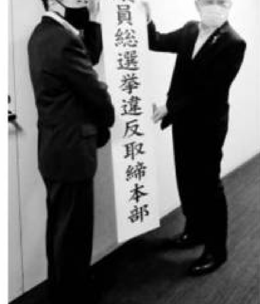
議員総選挙違反取締本部 本部を設置

前回2017年衆院選の女性当選者は47人で、14年から2人増えた。過去最大の09年の54人に次ぐものの、465人の当選者全体に占める割合は10・1%にすぎない。 政党別では自民党が20人で最多。旧立憲民主党が12人で続いた。立候補した女性は209人で全候補者の17・7%。女性候補の当選確率は22・5%で、男性の43・0%を大きく下回った。政府は女性候補割合を「25年までに35%」とする努力目標を掲げる。だが今回、第1党の自民党の立候補予想者を見ると女性は1割に満たないのが現状だ。